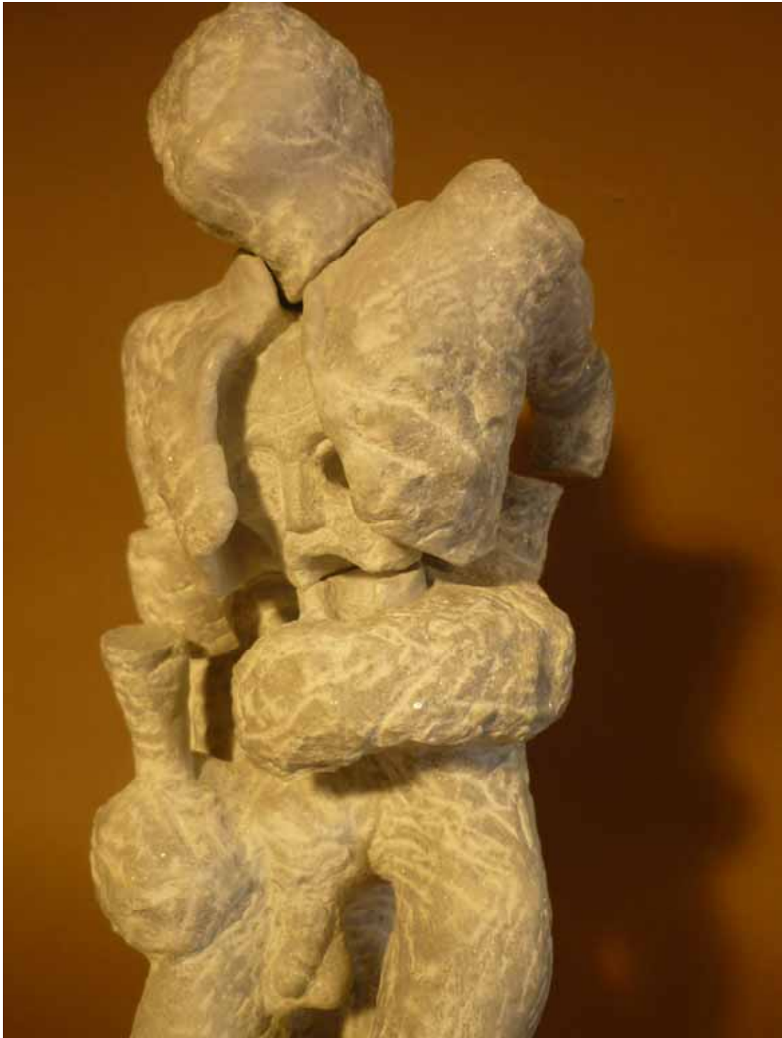
Der Tod des Philosophen, Detail