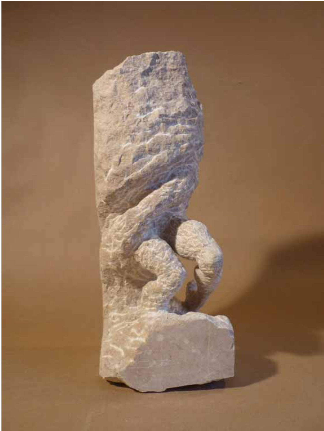
Ins Ungewisse Unterschberger Marmor (2010)