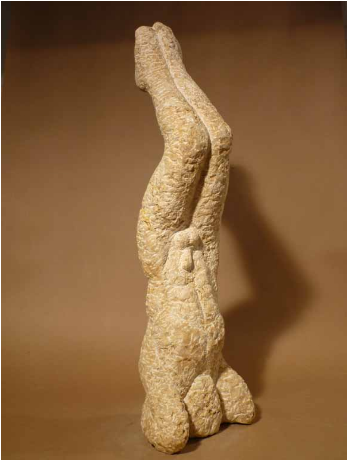
Poser Auerkalk (2004)