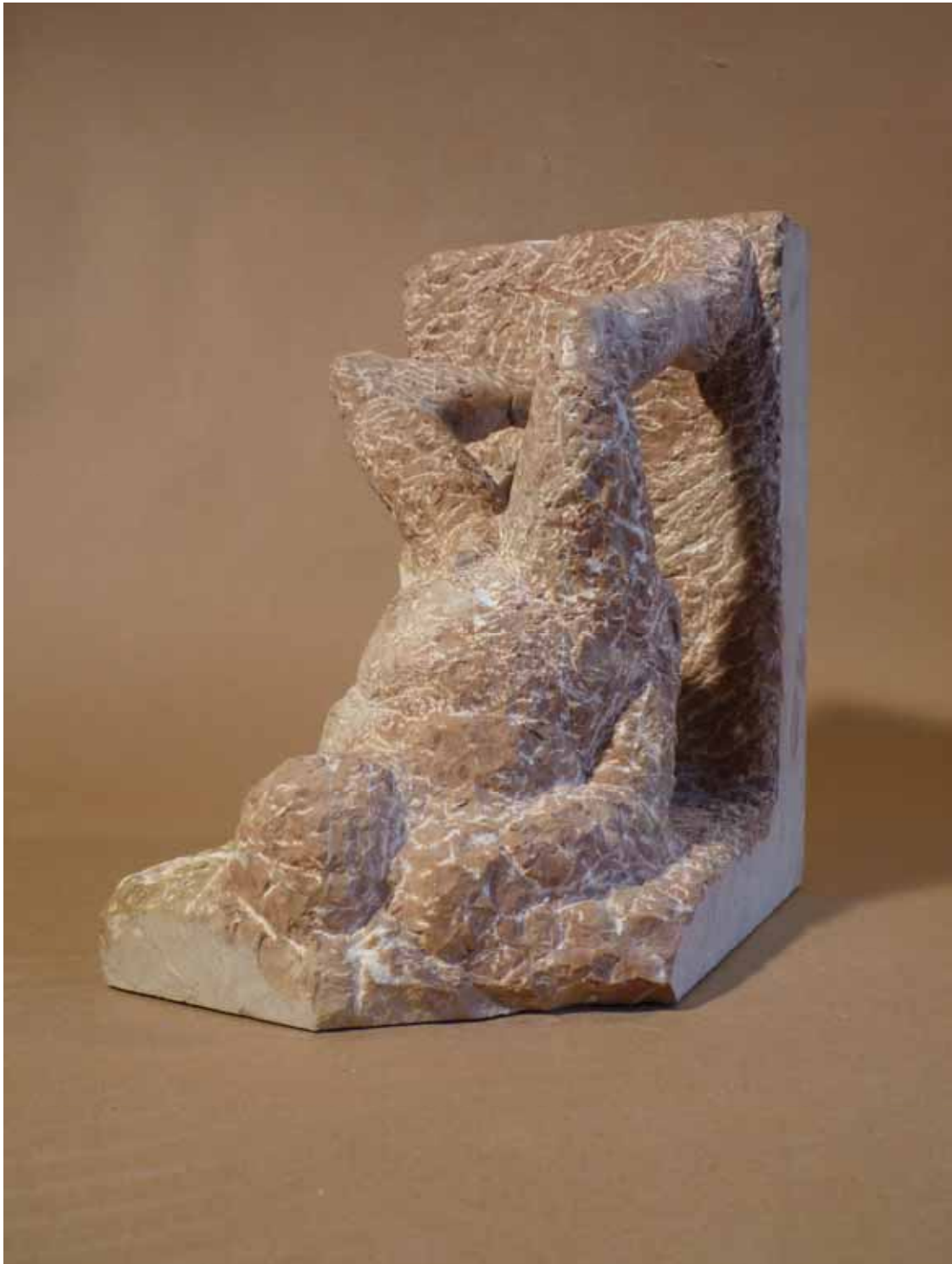
Die Wand hoch Bad Dürnberger Kalkstein (2007)