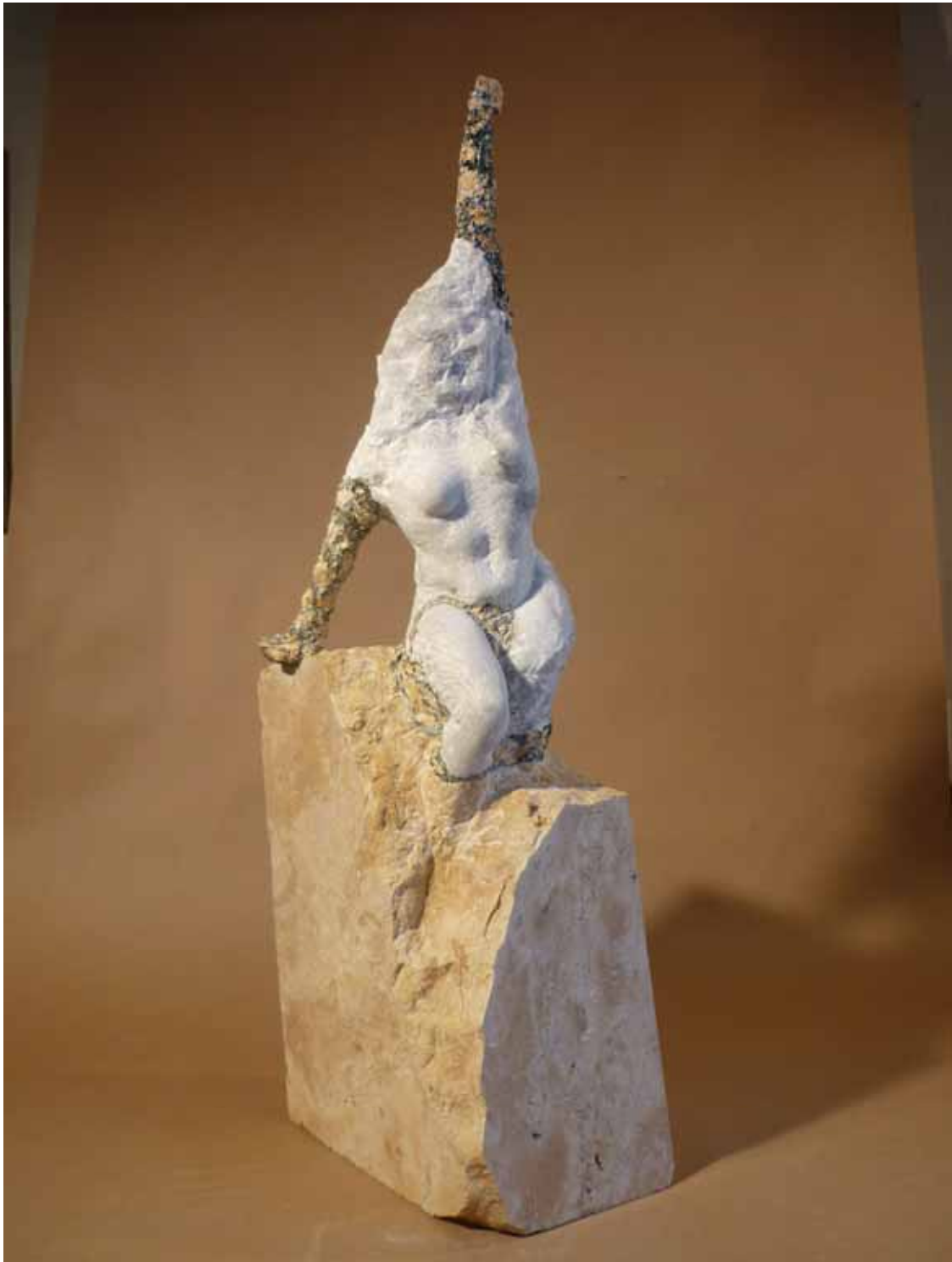
Göttin, restauriert Auerkalk, Epoxydharz, Pigment (2009)