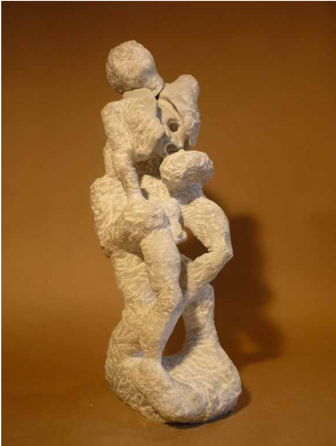
Der Tod des Philosophen